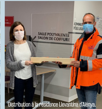
Distribution à la résidence Llevantina d'Alénya.