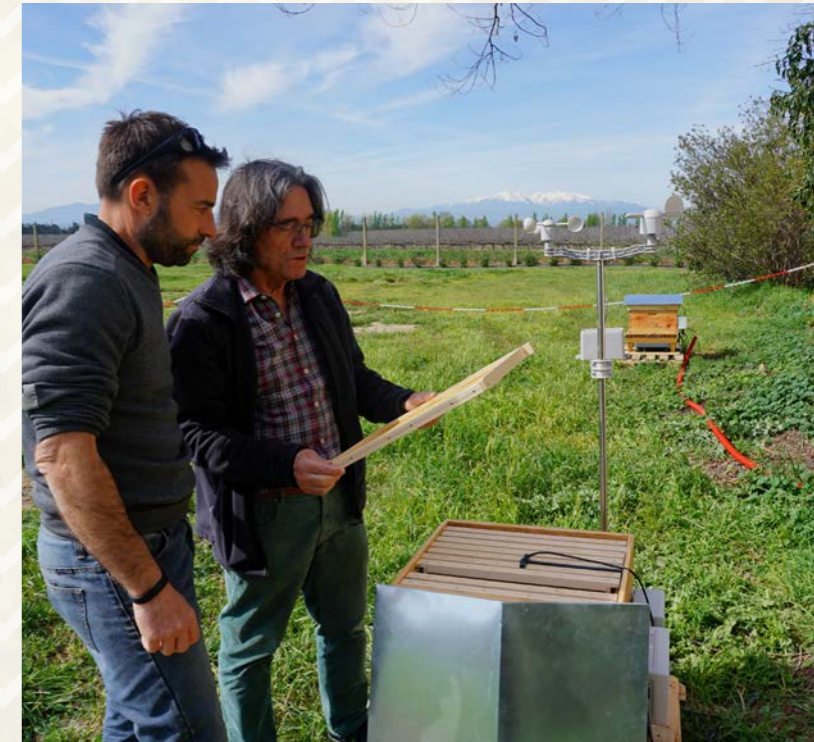
Un apiculteur et les agents de la station d'épuration vont collaborer pour ce projet.

Ce projet 100 % biodiversité devrait faire des émules.