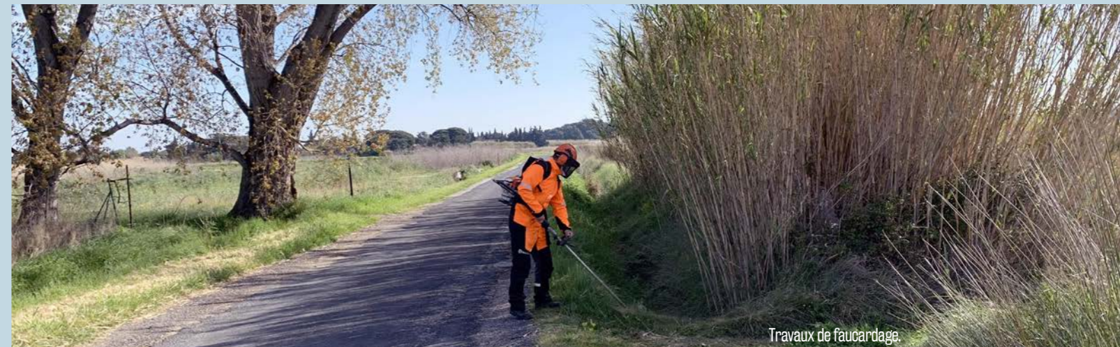
Travaux de faucardage.

Par ces travaux, la sécurité des usagers de la route a pu être optimisée, tout comme l'écoulement des eaux pluviales.