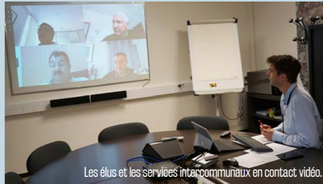
Les élus et les services intercommunaux en contact vidéo.

Face à l'impossibilité de se réunir, il a fallu s'adapter... Grâce aux visioconférences, élus et services administratifs et techniques ont pu maintenir le contact. Se consultant très régulièrement, tous ont fait avancer des dossiers et préparé la suite des événements.