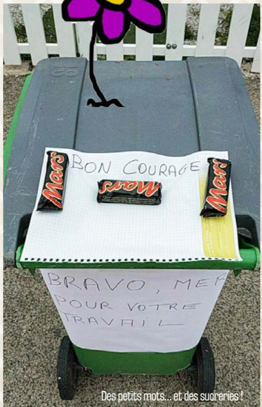
Des petits mots... et des sucreries !