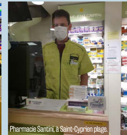
Pharmacie Santini, à Saint-Cyprien plage.