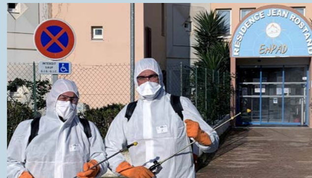
Cette campagne a été menée dans les six communes du territoire.