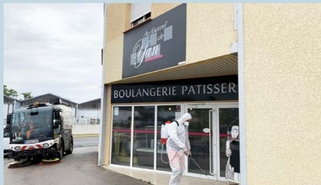
Une action très ciblée.

Ce dispositif exceptionnel a mobilisé des moyens matériels et humains de la Communauté de communes et de la commune de Saint-Cyprien. Polyvalents, les maîtres-nageurs ont été déployés sur cette action.