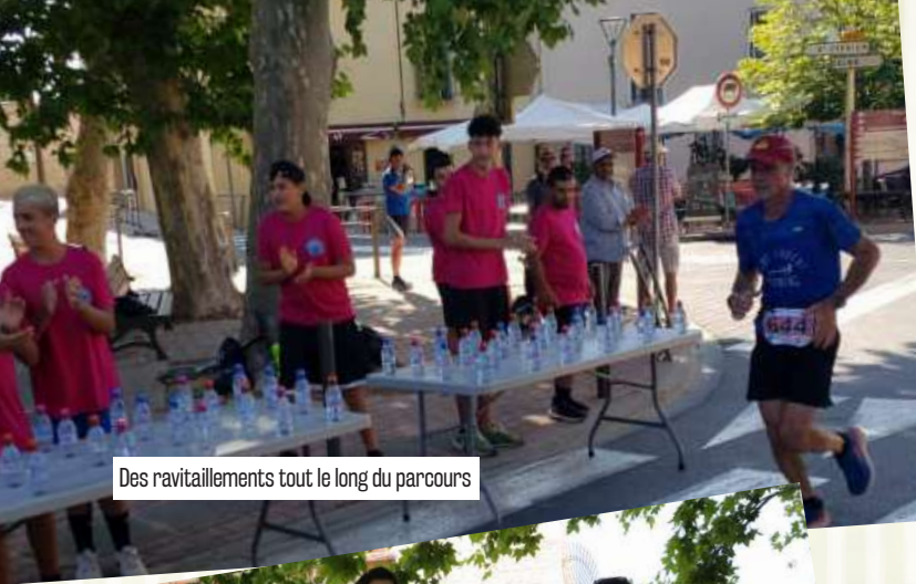
Des ravitaillements tout le long du parcours