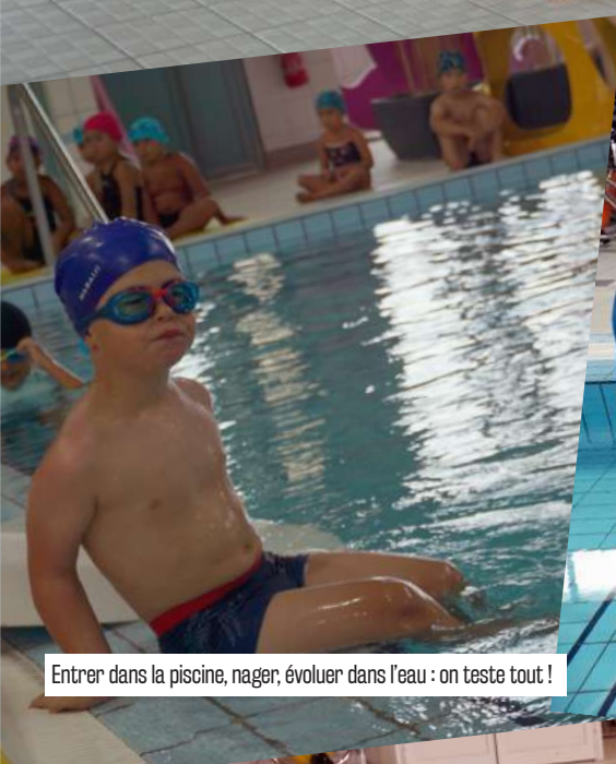
Entrer dans la piscine, nager, évoluer dans l'eau : on teste tout !