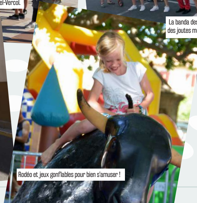
Rodéo et jeux gonflables pour bien s'amuser !