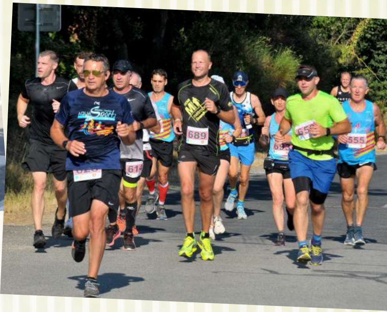
Et coucou, avec le sourire ! De nombreux coureurs de notre partenaire Running 66 étaient là