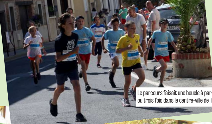
Le parcours faisait une boucle à parcourir une, deux ou trois fois dans le centre-ville de Théza