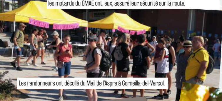
Les randonneurs ont décollé du Mail de l'Aspre à Corneilla-del-Vercol.