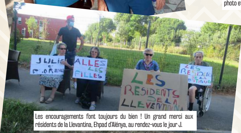
Les encouragements font toujours du bien ! Un grand merci aux résidents de la Llevantina, Ehpad d'Alénya, au rendez-vous le jour J.