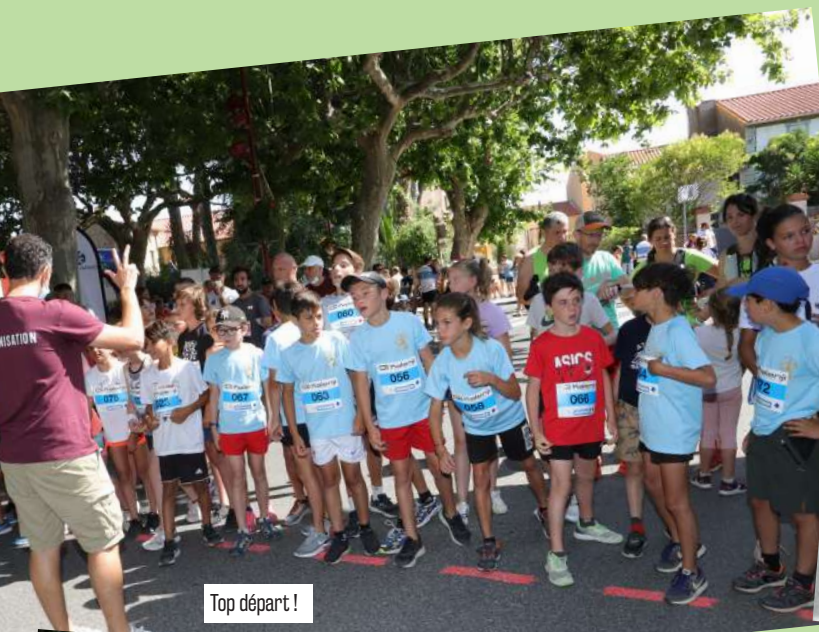
Top départ !

Par catégorie de 5 ans à 14 ans, une centaine d'enfants ont pris le départ des courses qui leur étaient dédiées. Tous très motivés malgré la chaleur, ils ont parcouru entre 400 m pour les plus jeunes et 1200 m pour les ados. Un moment très suivi par les familles et même leurs aînés des courses adultes.