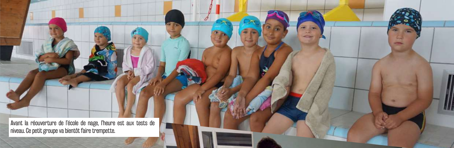
Avant la réouverture de l'école de nage, l'heure est aux tests de niveau. Ce petit groupe va bientôt faire trempe.