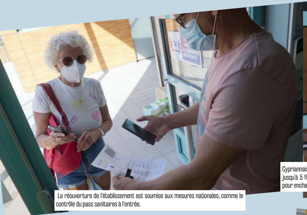
La réouverture de l'établissement est soumise aux mesures nationales, comme le contrôle du pass sanitaires à l'entrée.