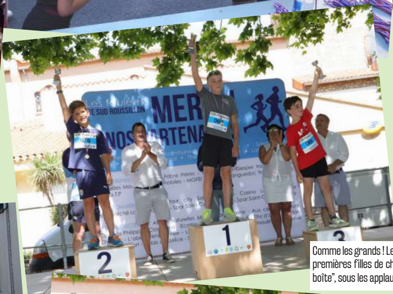
Comme les grands ! Les trois premiers garçons et les trois premières filles de chaque catégorie sont montés "sur la boîte", sous les applaudissements.