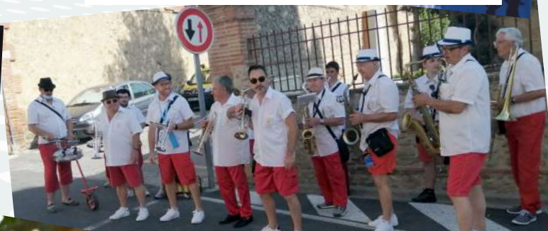
La banda des Canailous et la pena du Languedoc se sont livrées à des joutes musicales après la remise de prix.