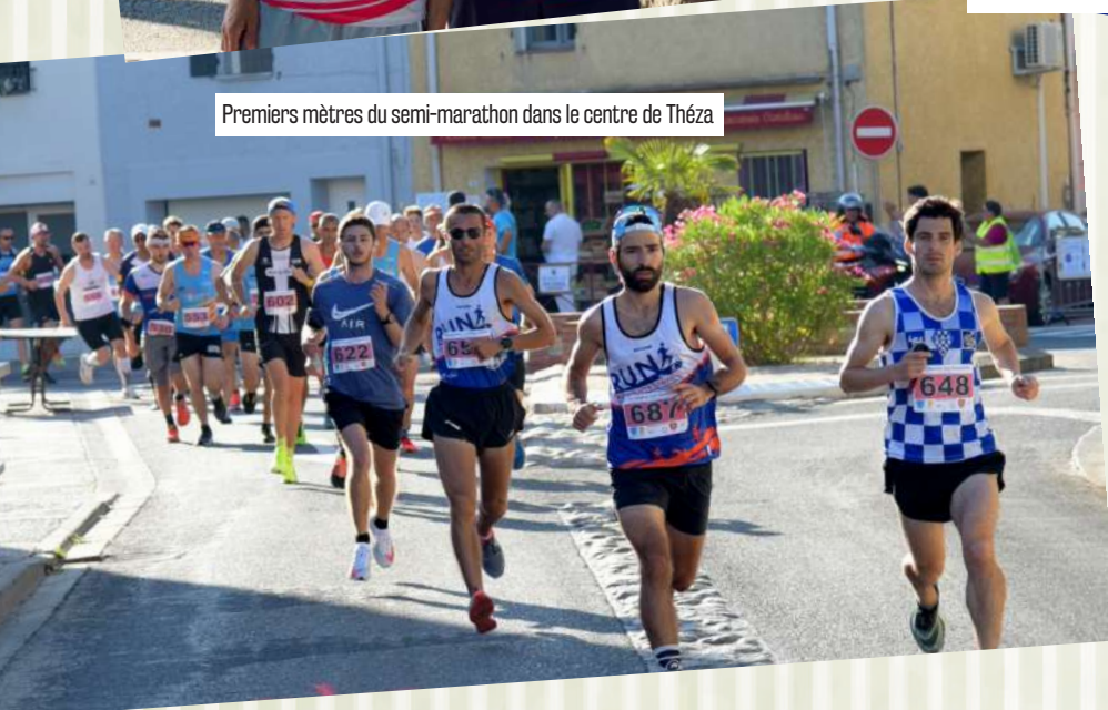
Premiers mètres du semi-marathon dans le centre de Théza