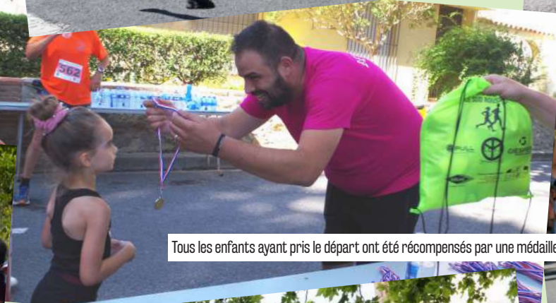
Tous les enfants ayant pris le départ ont été récompensés par une médaille et des petits cadeaux