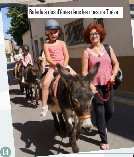
Balade à dos d'ânes dans les rues de Théza.