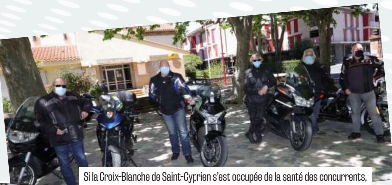
Si la Croix-Blanche de Saint-Cyprien s'est occupée de la santé des concurrents, les motards du GMAE ont, eux, assuré leur sécurité sur la route.

Pour cette première édition, les courses sont parties de la place de la Promenade de Théza. Tout un village départ a été monté pour coureurs et supporters. D'un côté, les stands de boissons et restaurants, ainsi que les commerces du village, entre food-truck, pizzeria et snacking. De l'autre, des animations en musique, un village enfants, l'espace récupération avec des kinés... A Corneilla-del-Vercol, le point de départ de la randonnée gourmande proposait petit-déjeuner le matin et repas à l'arrivée.