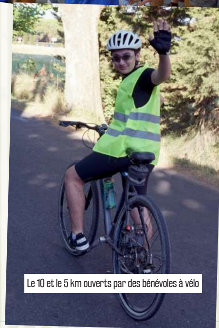
Le 10 et le 5 km ouverts par des bénévoles à vélo