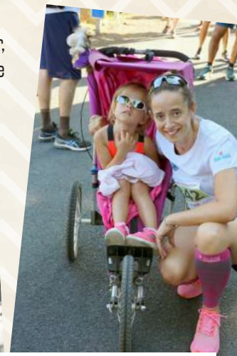
D'autres couraient plus confortablement installés.