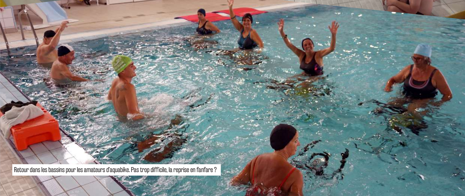
Retour dans les bassins pour les amateurs d'aquabike. Pas trop difficile, la reprise en fanfare ?