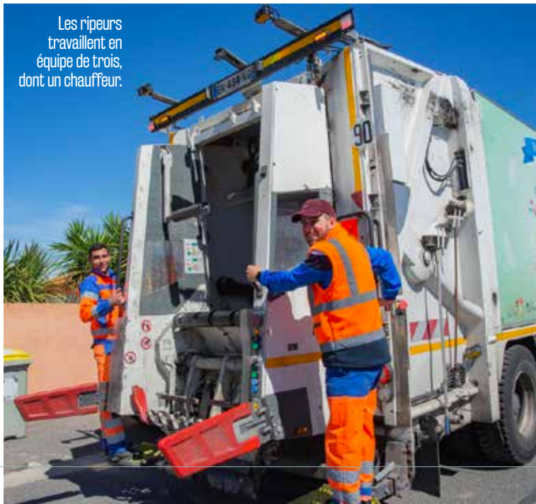
Les ripeurs travaillent en équipe de trois, dont un chauffeur.

Un peu avant 11 h, retour à la Communauté de communes. Mais pas sans avoir nettoyé et désinfecté le véhicule dans une station dédiée. Les camions doivent être impeccables. La tournée s'achève en fin de matinée... Rendez-vous le lendemain, pour une nouvelle collecte.