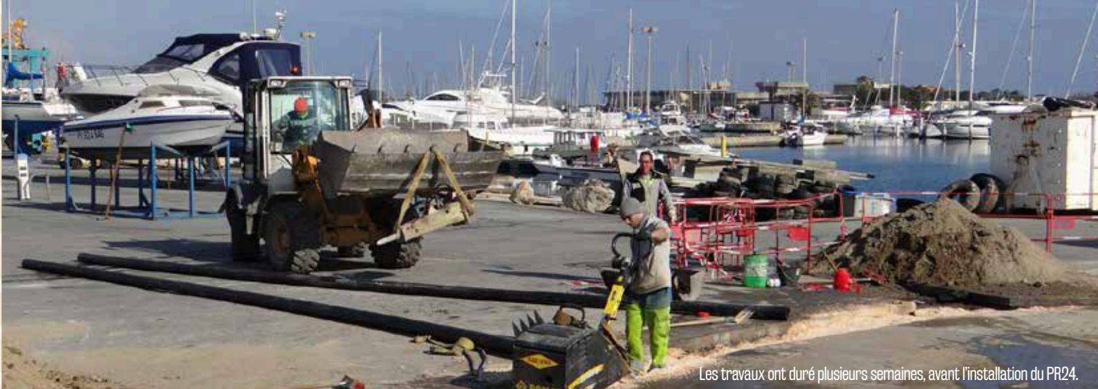
Les travaux ont duré plusieurs semaines, avant l'installation du PR24.