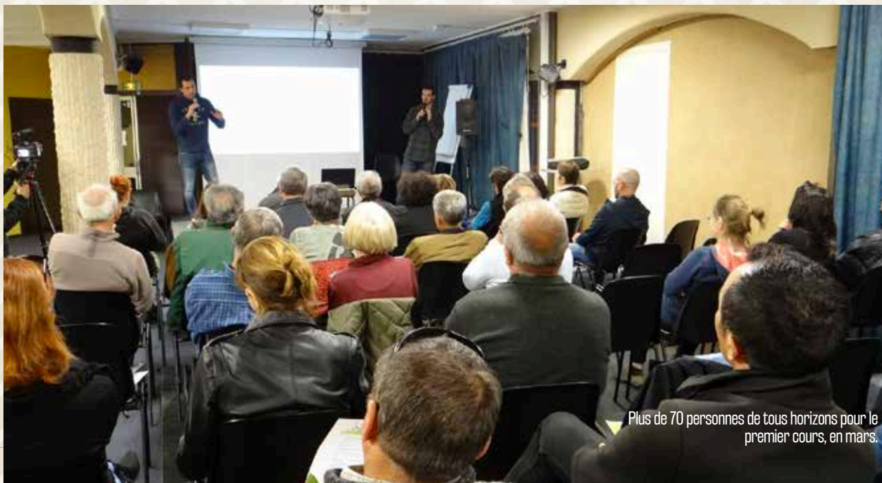
Plus de 70 personnes de tous horizons pour le premier cours, en mars.