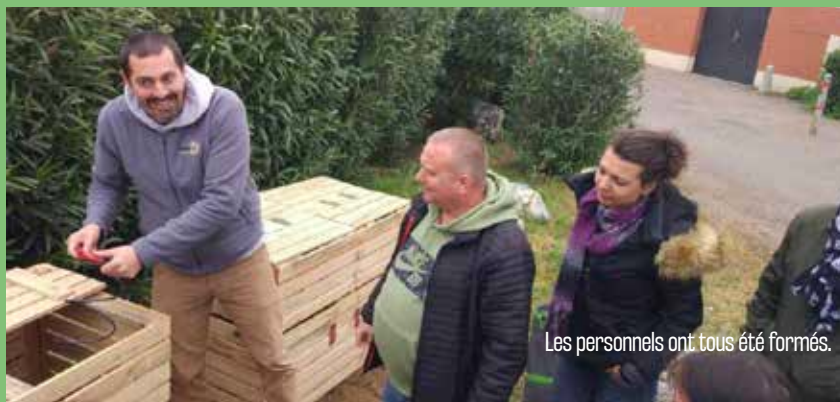
Les personnels ont tous été formés.

Des composteurs collectifs ont été installés par Sud Roussillon et le Sydetom 66 au centre de vacances CCAS de Saint-Cyprien. Les personnels du site ont été formés à l'utilisation du dispositif par les équipes du Sydetom 66. Les vacanciers et résidents peuvent donc désormais composter en toute tranquillité. Cette action, menée en concertation par la direction du CCAS, Sud Roussillon et le Sydetom 66, vise à réduire la production de déchets et à valoriser les déchets alimentaires.