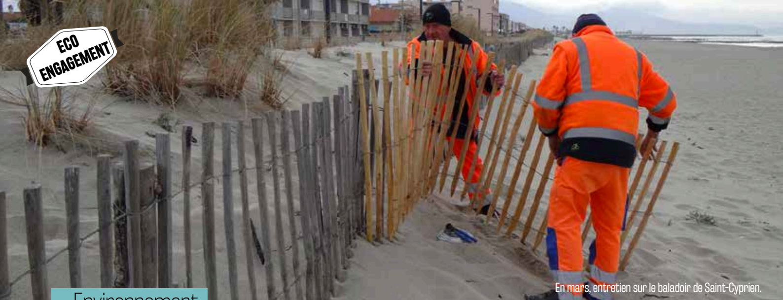
En mars, entretien sur le baladoir de Saint-Cyprien.