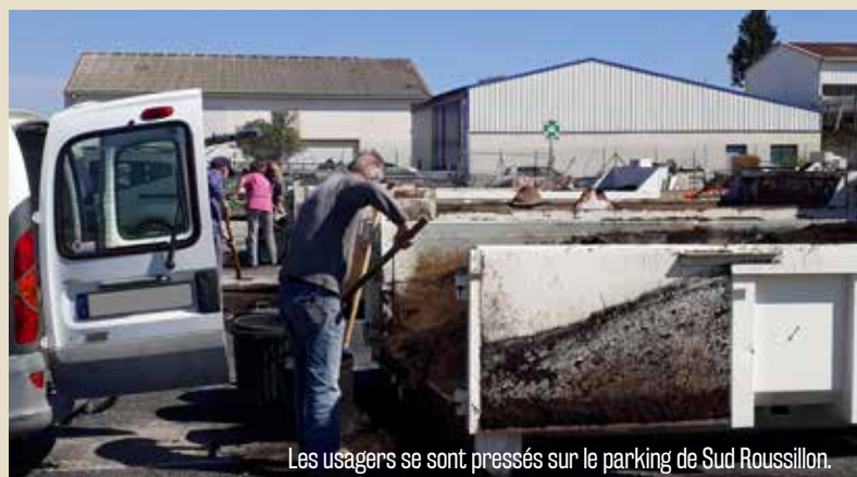
Les usagers se sont pressés sur le parking de Sud Roussillon.