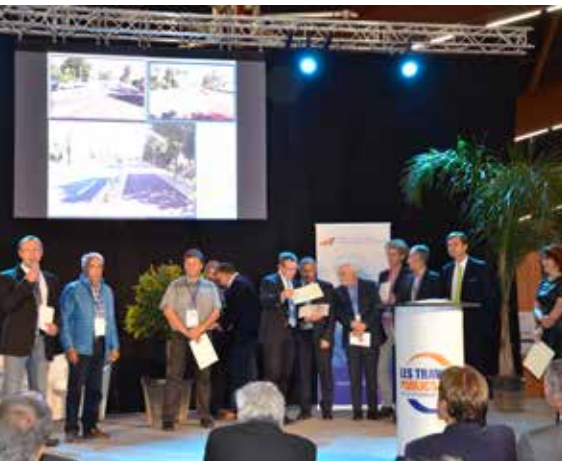
Le prix a été remis lors du Salon des Maires, des Elus locaux et des Décideurs publics en mars.

Long de 1,2 km, ce sentier multi-usages est aujourd'hui accessible aux piétons, aux cyclistes, aux utilisateurs de rollers, de trottinettes ou de skate-boards. Une partie du chemin, plus souple, est prévue pour les joggers. L'ensemble a été sécurisé, notamment grâce à des potelets lasers. Au cœur d'une réflexion globale sur le développement des voies douces et le maillage de l'ensemble du territoire, l'aménagement de ce tronçon était une des priorités de la Communauté de communes.